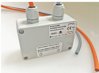
HOLOS Air Lite Knoten

Klicken Sie auf diesen Link, um weitere Informationen anzuzeigen