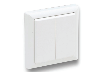
HOLOS Air Lite 2Key Schalter

Stattdessen entschieden sich die Veranstalter für einen Alternativvorschlag von Holophane, nämlich die Aufrüstung der bestehenden Beleuchtung. Die Curlinghalle war ursprünglich mit Holophane Primalume Halogen-Metaldampfleuchten ausgestattet worden. Diese boten zwar gutes Beleuchtungsniveau und Farbwiedergabe, konnten jedoch nicht die für Fernsehübertragungen notwendigen 1500 Lux leisten.